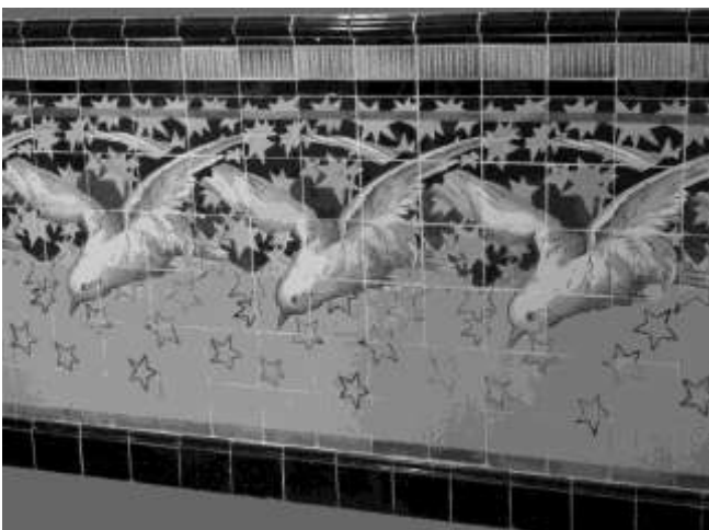
Art nouveau lambrizing in Aveira