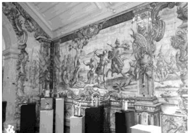
Kapel in Caldas da Rainha