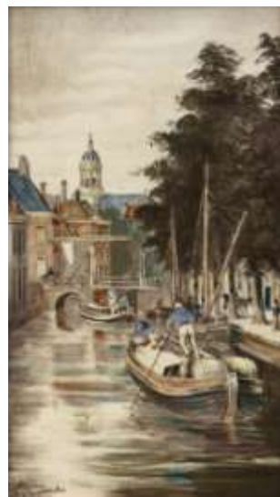
Stadsgezicht Leiden 1890

De STANYA-collectie werd 25 jaar geleden een begrip in de wereld van verzamelaars en liefhebbers van de Haagse