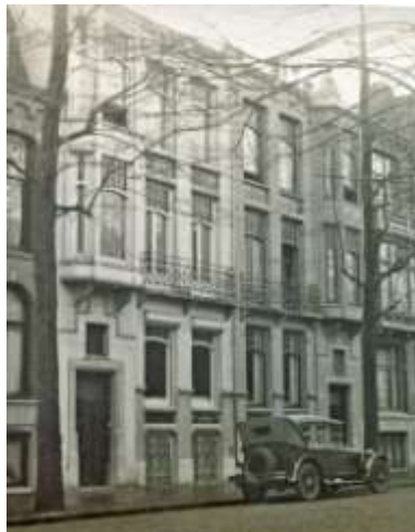
1. Huizen Van Eeghenstraat 175, 177. ca 1925

Mijn grootvader van vaders zijde heeft daar in 1901 een jaar gewoond op nummer 89. In 1925 kwam mijn grootmoeder van moederszijde te wonen op nummer 177, gebouwd in 1900, waar in 1927 mijn moeder werd geboren. In de jaren dertig zijn