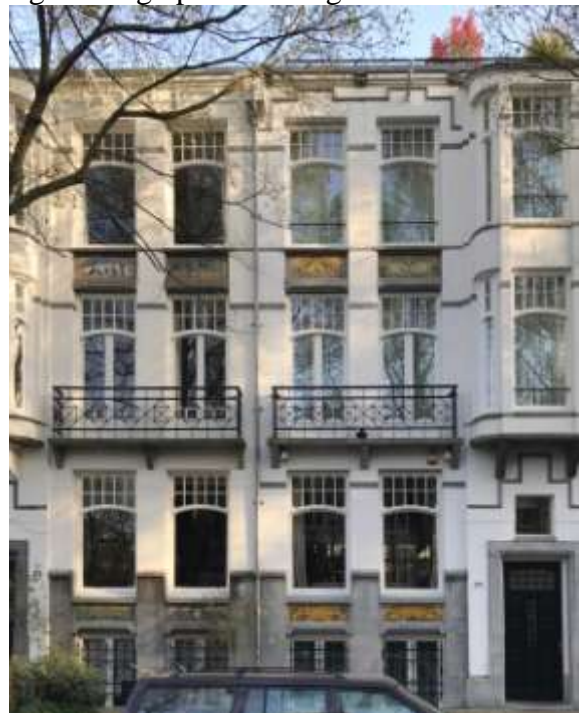
3. Situatie Van Eeghenstraat 175, 177 in 2025

Dat verklaart misschien mijn belangstelling voor tegels. Van mijn moeder hoorde ik dat het huis ooit tegels aan de buitenkant had, maar dat die eind jaren '20 zijn verdwenen. Het leuke is dat er een foto is uit het begin van de jaren '20 waar die tegels zijn te zien. In het stadsarchief van Amsterdam is nog een bouwtekening van het huis uit 1900 waarop tegeltableaus staan aangegeven. Drie tegels hoog op de bovenste etage en twee tegels hoog op de bel-etage.