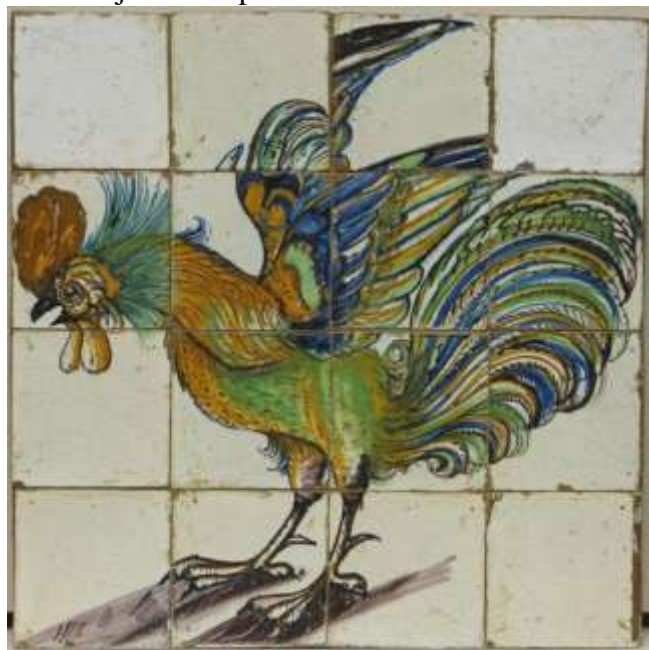
Boijmans Van Beuningen, inv.nr. A 3376

een uniek zeventiende-eeuws tableau van een vechtende haan, in de collectie van Museum Boijmans Van Beuningen! Het gaat om een werk van de Goudse plateelbakkerij van Willem Jansz. Verswaen, te dateren rond 1625, het was een al vaker gepubliceerd tableau in de periode dat Swiebertje ontworpen werd.