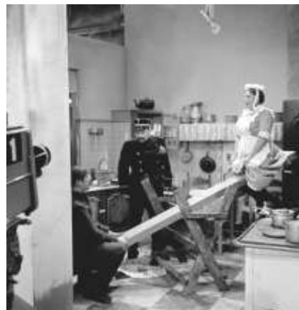
Foto tijdens de opname van 20 september 1963 van aflevering 1, 'Saartje in de knel'.

We zien in de uitzendingen een ideaaltypische oud-Hollandse keuken, en die kan uiteraard niet zonder tegels. Die keuken veranderde wel door de jaren heen, hoewel de plattegrond en indeling in de loop der jaren in wezen hetzelfde bleven. Veel kijkers hadden na enkele jaren toch het gevoel dat ze er blindelings de weg zouden weten. Foto's die in de jaren zestig zijn gemaakt tijdens de opnamen, tonen wanden met heel strakke en effen, industriële lichtgroene tegels. Op een vroege ontwerp-tekening werd 'licht-blauw tegelboard' voorgesteld. Het gaat hier duidelijk om een studio-opname, op sommige foto's zie je dat de wanden niet doorlopen tot aan het hoge plafond.