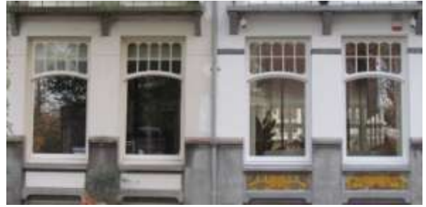
2. Situatie Van Eeghenstraat 175, 177 in 2020

alle tegels bij een schilderbeurt achter witte verf verdwenen.