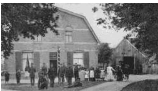
Waldhoorn anno 1906

Dit jaar vindt de jaardag weer plaats in Otterlo. U leest hierover later meer, maar de datum 27 september kunt u alvast in uw agenda noteren. Laten we hopen elkaar in goede gezondheid weer te treffen.