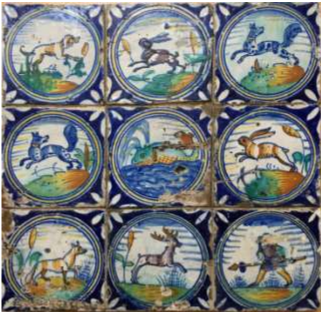
Klaas Bert Mazereeuw

Mijn interesse gaat uit naar tegels met afwijkende formaten, of met mooie, fijn geschilderde voorstellingen, met name mythologie en vroege ornamenten, en nog veel meer (eigenlijk gewoon alles dus). Inmiddels verzamel ik toch al wel een ruime twintig jaar.