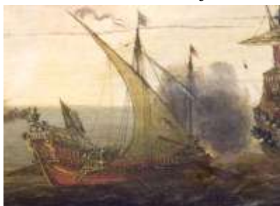
Frans Klein, lid expositiecommissie

oorlog zetten de Spanjaarden galeien in zoals bij de slag op de Haarlemmermeer in 1583. Ook in de Zeeuwse wateren werd de galeien ingezet. Op schilderijen van zeeslagen uit het begin van de 17 e eeuw zijn ze dan ook vaak te zien. Ook de verenigde Republiek liet een paar galeien bouwen om in te zetten bij windstilte. De Spaanse galeien zijn te herkennen aan de Habsburgse vlag. Een andreaskruis zoals op deze tegel ook is te zien. Deze afbeelding zou kunnen zijn ontleend aan een schilderij van Cornelis Bol (1589-1666)