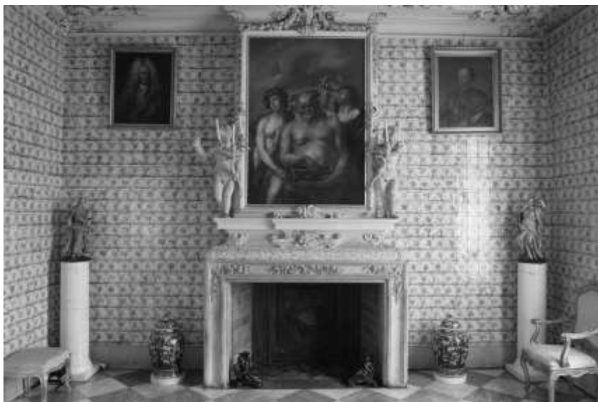
De Bachus kamer in Lazienki paleis, Warschau.

In het midden van Polen, rond Warschau, heeft de Utrechtse architect Tielman van Gameren (1632-1706) vele paleizen, buitenplaatsen en kerkelijke gebouwen ontworpen. Het vak had hij geleerd bij Jacob van Kampen, de architect van het Stadhuis/Paleis op de Dam. In 1660 nodigde de Poolse Prins Jerzy Lubomirski hem uit als architect van vestingwerken. Na 1670 steeg zijn faam en verwierf hij vele opdrachten in hofkringen. Polen beleefde toen het einde van een "gouden" tijd (1500 – 1700) met de regering van koning Jan III Sobiesko (1629-1696), voordat het land in 18 e eeuw veel gebied verloor en tenslotte werd verdeeld onder Rusland, Pruisen en Oostenrijk. Jan III Sobiesko was een getalenteerd man die bekend is als "de held van Wenen" door zijn strijd tegen de Ottomanen (1683) tijdens het beleg van Wenen. In het voor hem gebouwde Wilanow paleis in Warschau is een speciale faience-kamer, geheel bekleed met tegels (zie weblink). Deze kamer willen we zeker bezoeken tijdens de excursie. De Poolse adel liet door Van Gameren ook paleizen met Nederlandse tegels bouwen waaronder het Lazienki paleis in een park in Warschau en het Nieborow paleis in Nieborow, 80 km ten westen van Warschau.